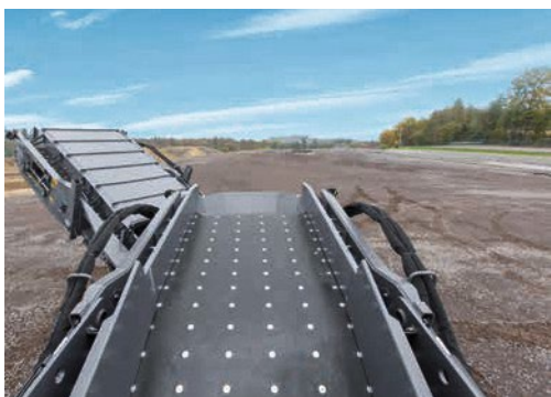
Flexibilidad de utilización – cinta basculante disponible opcionalmente con 6,5 m (OC 650) para BMF 2500 S.