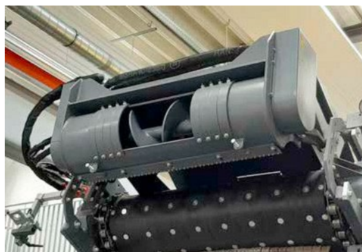
Uso flexible, la unidad de mezcla FLEXMIX se puede plegar hidráulicamente.