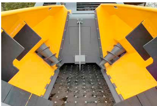
FLEXMIX: mezcla de material ideal desde el principio.