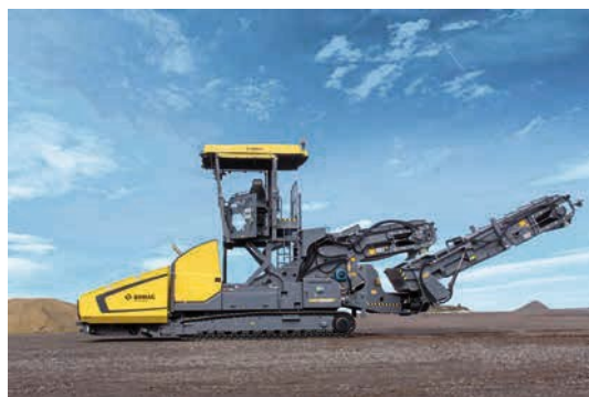
Todo a la vista – la plataforma elevable ofrece una excelente visión panorámica.